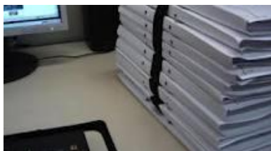
As quatro Varas da Fazenda têm, juntas, aproximadamente 400 mil processos em andamento.

O relatório final, com as conclusões e propostas da Corregedoria, está sendo finalizado e será encaminhado na próxima semana ao Presidente do Tribunal e aos demais integrantes do Órgão Especial, para conhecimento e providências que se fizerem necessárias.