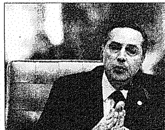
Barroso criticou o sistema atual no plenário do STF

discutida abertamente nesta semana no Congresso Nacional, sendo defendida pelo presidente da Câmara, Rodrigo Maia (DEM-RJ) e do Senado, Eunício Oliveira (PMDB-CE). Pelo sistema, o partido define uma ordem de preferência de candidatos ao Legislativo e o eleitor vota na legenda. ■