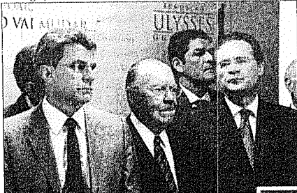
Jucá, Sarney e Renan teria feito pacto para barrar a Lava Jato