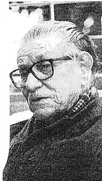
Heller virou referência sobre ditadura militar no Brasil.