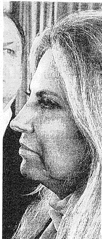
Alheios a denúncias, Osmar Dias, Ratinho Jr. e Cida Borghetti parecem sair em vantagem.