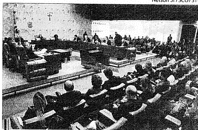
Sessão plenária do Supremo Tribunal Federal

No julgamento, prevaleceu o entendimento do ministro Alexandre de Moraes, para quem o interesse público na manutenção da segurança e da paz social deve estar acima do interesse de determinadas categorias de servidores públicos. Para Mo-