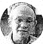
Paulo Hartung PMDB-ES

Citação: Recebeu R$ 8 mi de caixa dois em campanhas para favorecer Odebrecht Outro lado: Nunca pediu ou recebeu recursos ilícitos