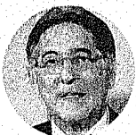
Fernando Pimentel PT-MG

Citação: Recebeu vantagens indevidas, a pretexto de campanhas eleitorais Outro lado: Doações de campanha foram legais