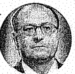
Gerardo Alckmin PSDB-SP

Citação: Pediu R$ 400 mil para campanha após defender interesses da Odebrecht Outro lado: Nega ter recebido recursos da Odebrecht