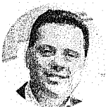
Marconi Perillo PSDB-GO

Citação: Recebeu vantagem indevida em espécie e em contas no exterior Outro lado: Nega ter recebido recursos ilícitos e possuir conta no exterior