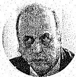
Luiz Fernando Pezão PMDB-RJ

Citação: Recebeu R$ 2 mi na campanha de 2010 e R$ 8,3 mi na de 2014, não contabilizados Outro lado: Jamais pediu ou recebeu recursos ilícitos