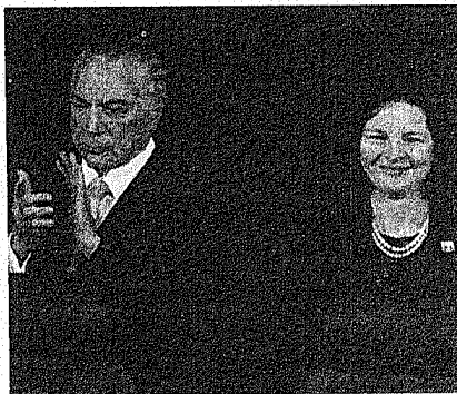
Temer e Dodge, ontem, na posse

administração de Justiça têm no respeito e harmonia entre as instituições a pedra angular que equilibra a relação necessária para se fazer justiça em cada caso concreto”, afirmou Raquel, que iniciou o discurso dirigindo-se ao povo brasileiro, “de quem emana todo o Poder”.