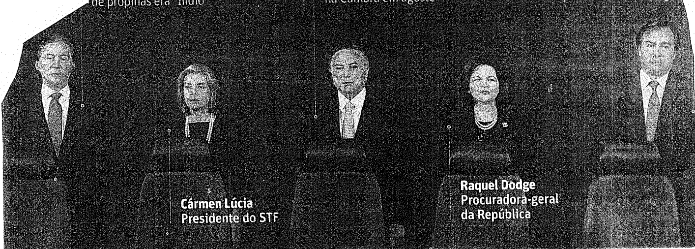
Cármén Lúcia Presidente do STF