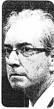
Cunha está condenado a 15 anos de prisão por corrupção

A votação foi realizada com quórum reduzido. Votaram contra a liberdade o relator, Edson Fachin, e o ministro Dias Toffoli, por entenderem que a questão da prisão pro-