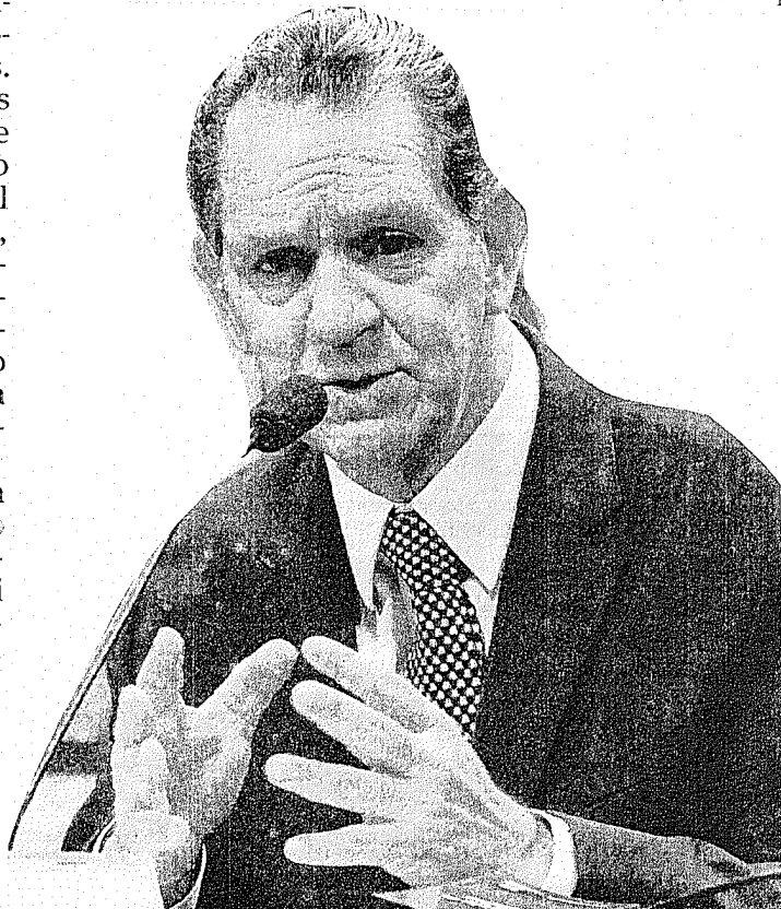
O corregedor nacional de Justiça, João Otávio de Noronha

"Fatos e circunstâncias novas nos processos tramitados na Justiça comum impuseram oitiva da parte contrária."