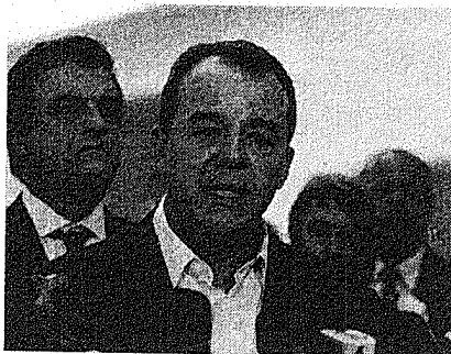
Cabral: fim das mordomias

Relatório do Ministério Público do Rio apontou luxos e muitas regalias