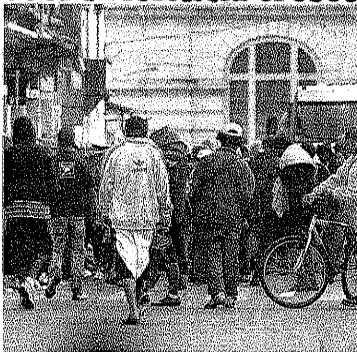
Capital. Usuários de crack ocupam a Rua Helvetia

A pesquisa foi feita com base em um questionário disponível na internet. O trabalho indica ainda que, entre os prefeitos en-