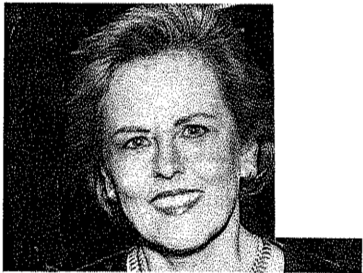
Rosa Candiota, ministra do Tribunal Superior do Trabalho

A escolha foi feita em reunião durante a tarde de ontem e confirmada pelo porta-