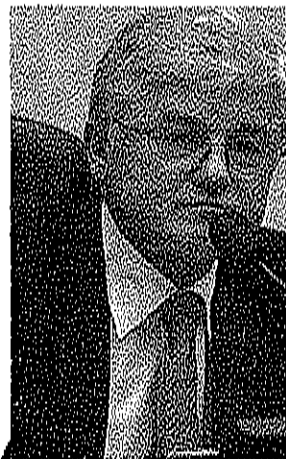
Rossoni: diante da repercussão, o tucano devolveu R$ 160 mil.

Diante da repercussão negativa da irregularidade após reportagem publicada pela Gazeta do Povo, o tucano, que inicialmente havia dito que não pretendia abrir mão do benefício, devolveu os R$ 160 mil recebidos pela gratificação e assinou o projeto que elimina o salário extra. O caso, porém, está sendo investigado pelo Ministério Público Estadual (MP), por meio da Promotoria de Defesa do Patrimônio Público.