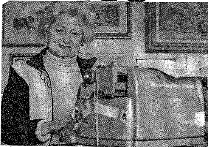
Juril foi a primeira jornalista mulher na redação.

A jornalista é ainda autora do livro "De Plácido e Silva, o Iluminado", uma biografia do