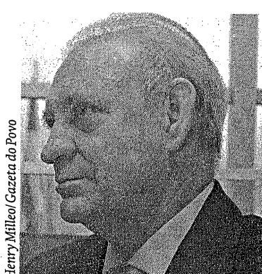
Henry Milleo/Gazeta do Povo

“A partir do momento que uma empresa pública visa única e exclusivamente o lucro, ela deixa de ter o papel de empresa pública e passa a agir no mercado como se fosse privada.”