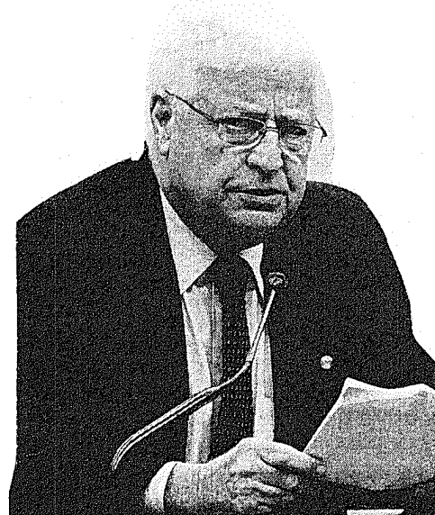
Meurer: defesa alega falta de provas

Após o voto de Fachin, o julgamento prosseguiria para tomada de votos dos demais integrantes do colegiado, os ministros Celso de Mello, Ricardo Lewandowski e Gilmar Mendes, mas até o fechamento desta edição, não havia terminado.