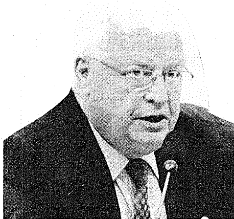
Nelson Meurer pode ser o primeiro da Lava Jato a ser condenado pelo STF

Se ao final prevalecer as posições de Fachin e Celso de Mello, será a primeira condenação de um político no STF em razão da Operação Lava Jato. A ação penal contra Meurer é a primeira da Lava Jato a ser julgada no tribunal. A defesa do deputado contesta as acusações contidas na denúncia da Procuradoria Geral da República e diz que não há elementos para justificar condenação. ●