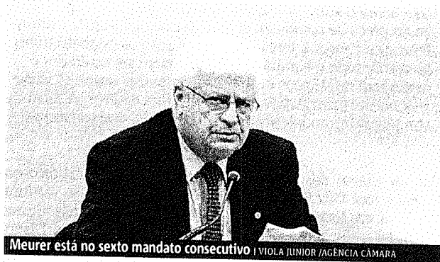
Meurer está no sexto mandato consecutivo

A decisão da 2ª Turma do STF foi unânime. Mas ainda cabe recurso. A defesa afirmou que a condenação ocorre porque Meurer foi líder do PP, por seis meses, em 2011, e anunciou que vai apresentar embargos de declaração, mas apenas depois da publicação do acórdão, o que pode demorar até dois meses.