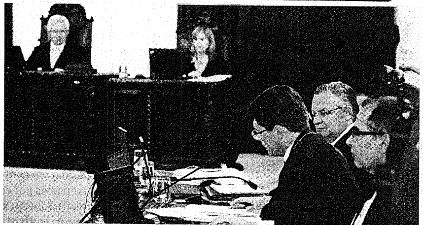
TCE: Tribunal diz que falar em impacto é “antecipar discussão”

“É apenas uma expectativa de direito. Para ser implantando seria necessária a apresentação de um novo projeto com estudo de impacto, para que seja possível a implantação específica. O estatuto prevê o que já é benefício do MP e TJ”, afirma a assessoria do TCE. O estatuto prevê uma série de propostas, com direitos e deveres de servidores. Para o tribunal, falar sobre impacto seria “antecipar uma discussão”, já que não há previsão de apresentação de um projeto para conceder o auxílio-saúde especificamente. O projeto dependeria de análise de orçamento do tribunal. Inicialmente, a instituição pretenderia adotar a mesma tabela do TJ, onde existem dez faixas de valores para o auxílio, escalona-