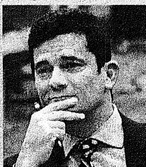
Moro acatou argumento de voto vencido no TRF-4

O esquema foi alvo da 48ª fase da Lava Jato, deflagrada em fevereiro, e Moro abriu o processo no início de abril. Entre os réus acusados de receber propina estão agentes do DER (Departamento de Estradas e Rodagem) no Paraná e até da Casa Civil do ex-governador Beto Richa (PSDB). À época da 48ª fase, ainda no cargo, o tucano afastou os