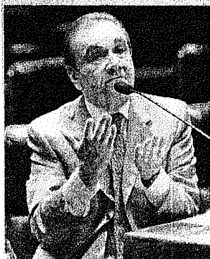
Senador se tornou réu pela 2ª vez

O senador José Agripino (DEM-RN) se tornou réu por corrupção passiva, lavagem de dinheiro e uso de documento falso. Por 3 votos a 2, a denúncia foi aceita ontem pela 2ª Turma do STF (Supremo Tribunal Federal).