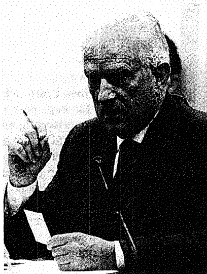
Bueno: fim de férias de 60 dias

pagos, segundo levantamento da comissão especial do projeto do teto remuneratório. Segundo o relatório, essa liminar já custou R$ 4 bilhões apenas à União.