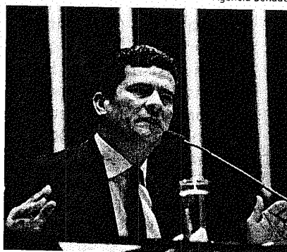
Moro: número de casos elevado

Os pedidos de exceção foram feitos por advogados de seis dos 17 réus da ação. Deflagrada em fevereiro deste ano, a Operação Integração resultou na prisão, entre outros envolvidos, do ex-diretor do Departamento de Estradas de Rodagem (DER/PR),