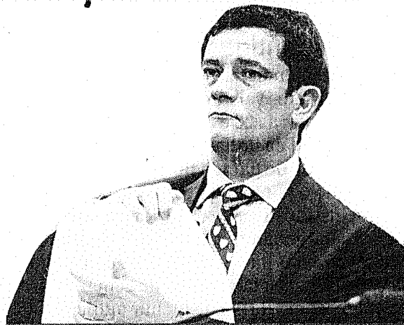
Moro segue à frente de ações relacionadas às demais fases da Lava Jato; "Integração" vai para a 23ª Vara Federal, também em Curitiba

É a primeira vez que o juiz federal, alegando excesso de trabalho, abre mão de um processo da Lava Jato