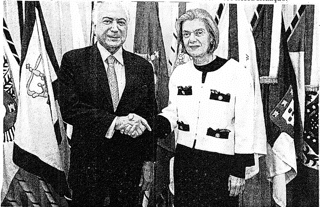
Michel Temer transmite temporariamente o cargo à presidente do STF nesta terça

O DEM já havia consultado o TSE (Tribunal Superior Eleitoral) sobre o assunto, mas o ministro Luís Roberto Barroso indeferiu o questionamento, afirmando que já há jurisprudência no tribunal sobre a inelegibilidade de candidatos nessa situação.