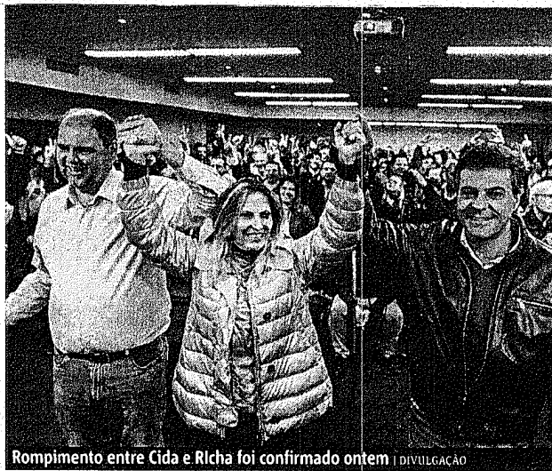
Rompimento entre Cida e Richa foi confirmado ontem

Ontem, através da sua assessoria, o ex-governador afirmou que só cabe a ele sair ou não disputa, que a sua posição é "irreversível", e que