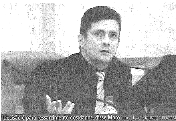
Decisão é para ressarcimento dos danos, disse Moro

Em abril, Moro decidiu que “a utilização de provas contra os próprios colaboradores” dependeria “de autorização específica”, segundo ele “devido ao risco de que os criminosos colaboradores se tornassem o alvo preferencial de sanções administrativas ou cíveis, colocando os próprios acordos em risco e desestimulando a sua celebração (...)”.