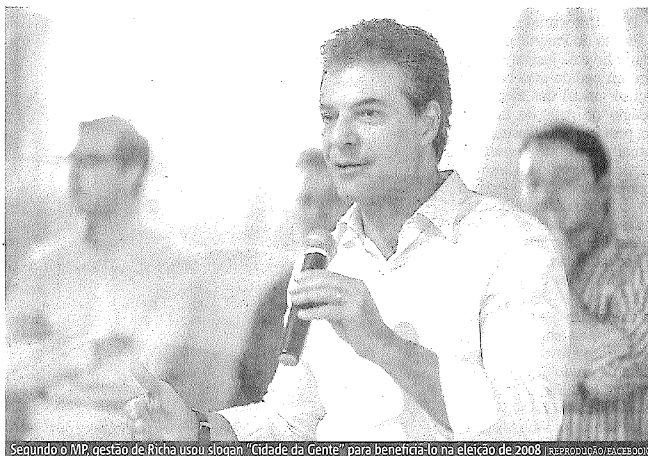
Segundo o MP, gestão de Richa usou slogan “Cidade da Gente” para beneficiá-lo na eleição de 2008

O MP alega que Richa “utilizou material de publicidade institucional para inserir símbolos e slogans de sua