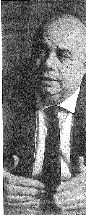
Mendes defende uma posição de consenso

"E você está falando de um ponto de vista mais amplo, se há uma