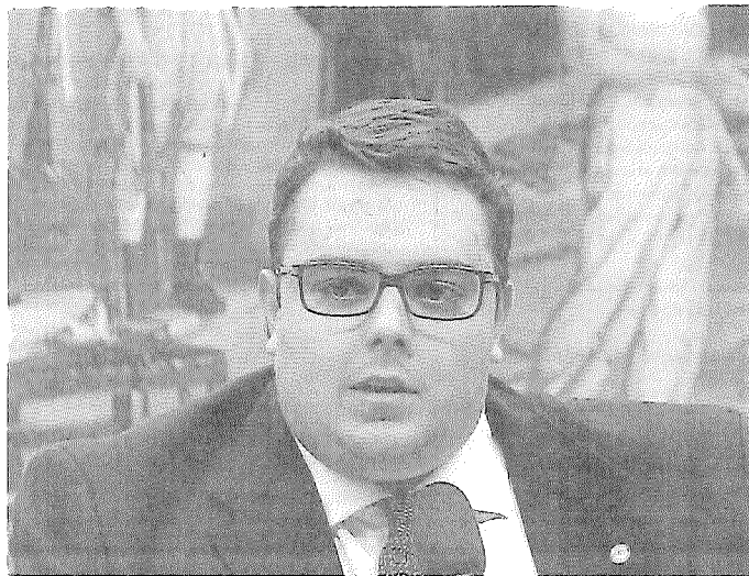
Aposta. Francischini: prioridade é agilizar a Previdência