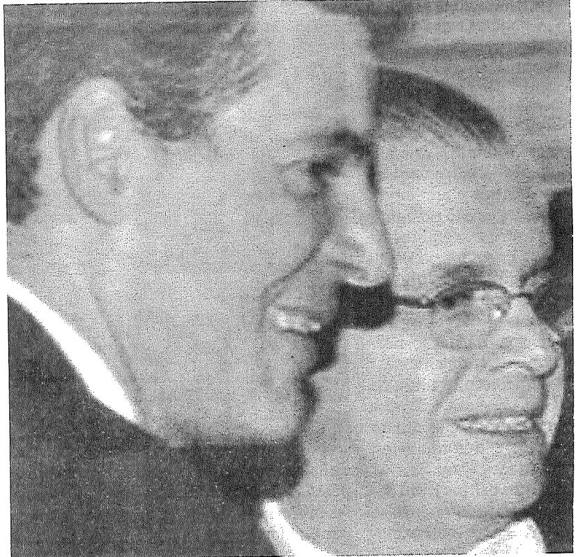
Moreira sempre foi próximo ao ex-governador Beto Richa

Atherino e Moreira foram presos em 19 de março, junto com o ex-governador, no âmbito da Operação Quadro Negro, que investiga desvios de mais de R$ 20 milhões em obras de escolas públicas, entre 2012 e 2015. Richa foi solto no dia 4 deste mês, após 17 dias preso. ■