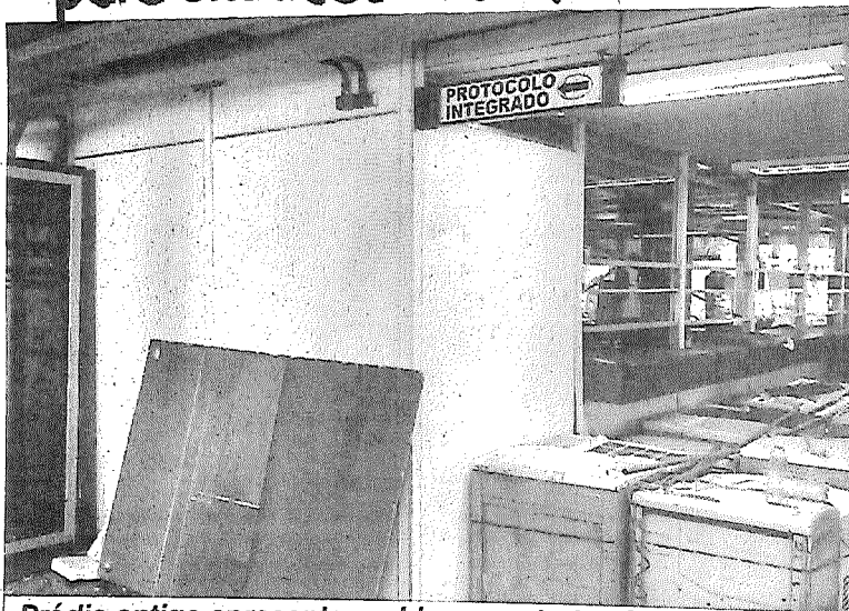
Prédio antigo apresenta problemas estruturais, incompatíveis com o bom funcionamento do Fórum