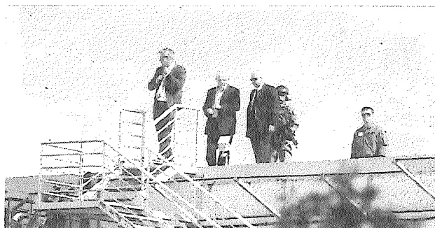
Franklín de Freitas

O ex-presidente, no entanto, responde a outros processos e já foi condenado em outro caso, o do sítio de Atibaia, em primeira instância. Em janeiro deste ano, a juíza Gabriela Hardt condenou Lula a 12 anos e 11 meses por corrupção e lavagem de dinheiro no processo da Lava Jato que apura se o ex-presidente