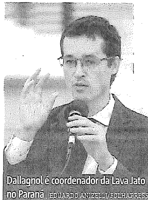
Dallagnol é coordenador da Lava Jato no Paraná

O procurador será chamado a prestar esclarecimentos