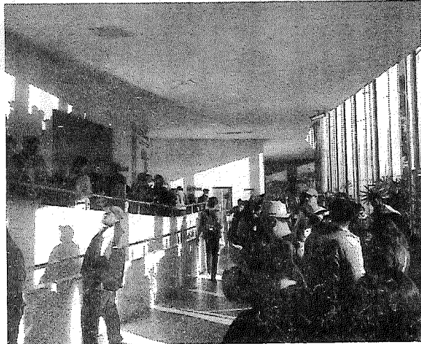
Os manifestantes ficaram nos corredores e galerias da Assembleia

Com a ocupação, os servidores esperam receber uma nova pro-