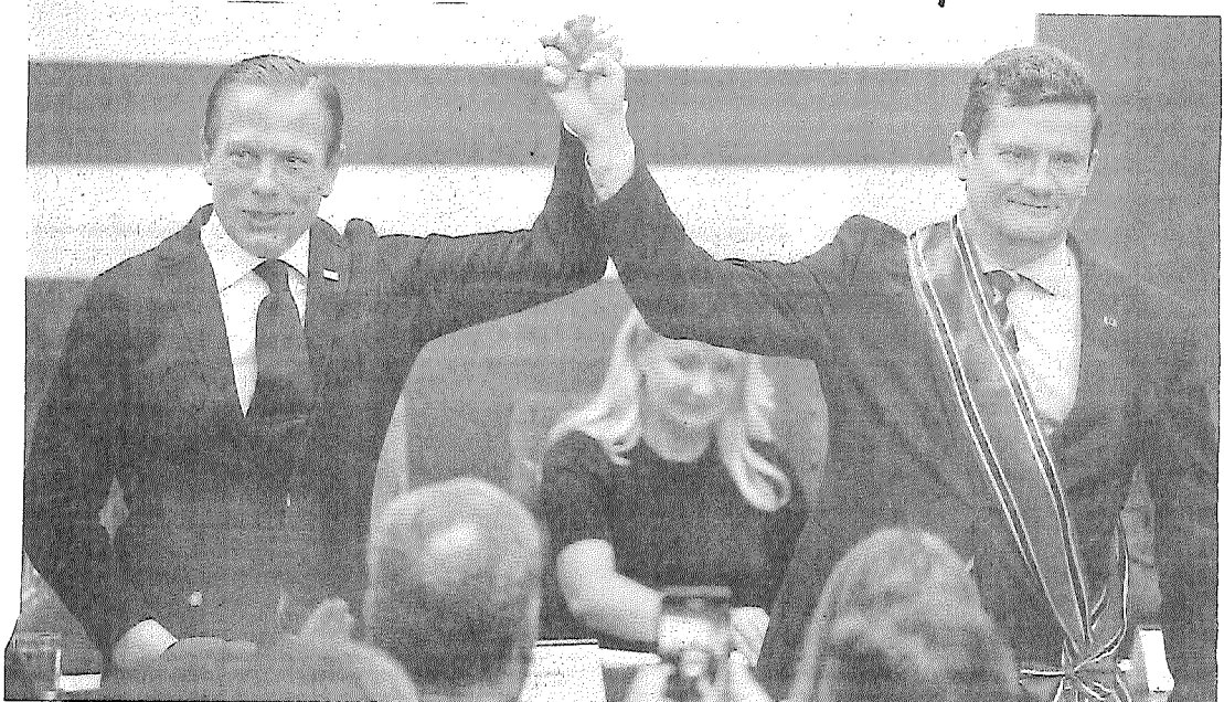
Doria entrega a Moro a Ordem do Ipiranga, principal honraria de SP

Em entrevista, governador paulista afirma que reeleição 'não costuma funcionar bem' no país