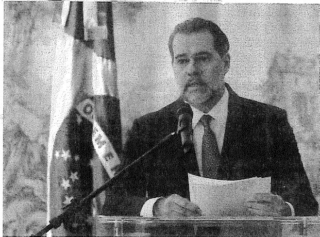
Toffoli decidiu que investigações em curso devem esperar decisão definitiva da Suprema Corte

Ele determinou que, a contar da data da decisão, todos os processos que discutem provas obtidas pelo Fisco e pelo Coaf sem autorização judicial devem esperar decisão definitiva da Corte. O julgamento que irá analisar o tema do com-