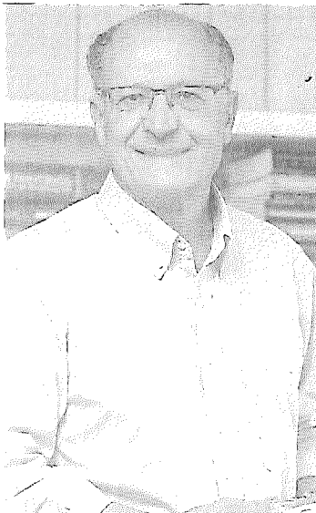
O ex-governador tucano Geraldo Alckmin