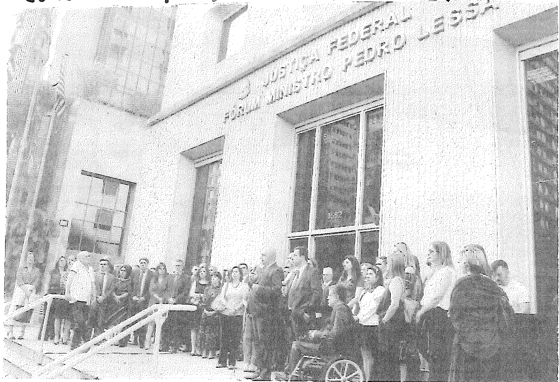
Magistrados reunidos em frente a prédio da Justiça Federal na avenida Paulista, em São Paulo, em ato em solidariedade a juíza atacada na quinta-feira

Ministro do STF liga declaração de ex-PGR a episódio em SP ao comentar operação de busca autorizada por ele