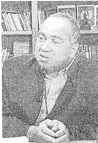
Juiz foi afastado do caso Eike.

O Ministério Público Federal ofereceu denúncia contra o juiz federal Flávio Roberto de Souza, na terça-feira passada (31), por falsidade ideológica e peculato. Souza é acusado de ter falsificado documentos e desviado dinheiro, apreendido num processo contra um traficante, para comprar um carro de luxo e um apartamento para ele próprio.