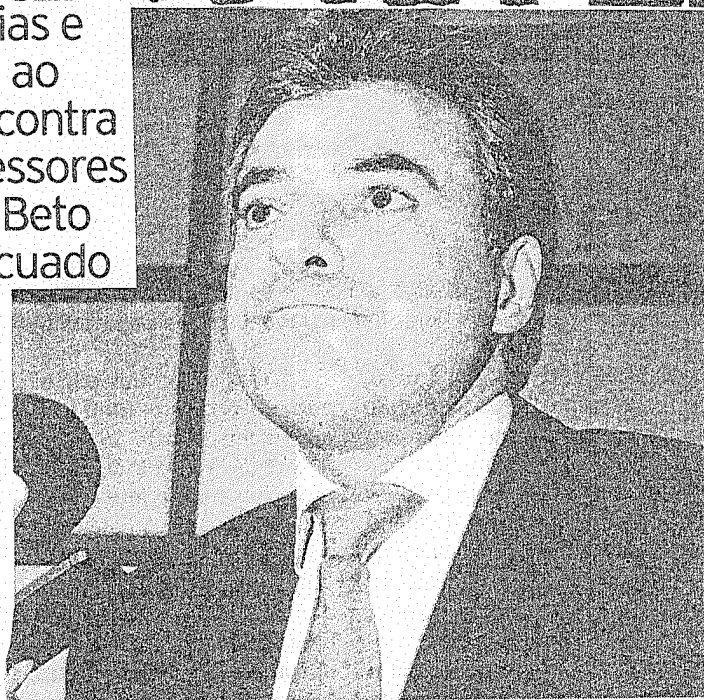
Governador sofre pressão e deve trocar secretário e comando da PM.

Denúncias e reações ao ataque contra os professores deixam Beto Richa acuado