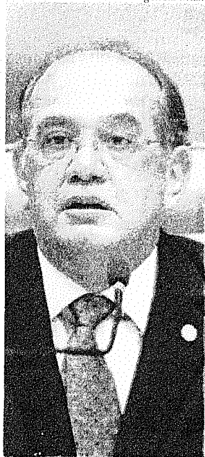
Mendes: "Porte não pode receber tratamento criminal"

O Supremo Tribunal Federal (STF) deve retomar na próxima quarta-feira (9) o julgamento sobre a descriminalização do porte de drogas, interrompido dia 20 de agosto por um pedido de vista do ministro Edson Fachin. O ministro Gilmar Mendes já votou a favor da descriminalização do porte de drogas. Segundo Mendes, a criminalização é uma medida desproporcional e fere o direito à vida privada.