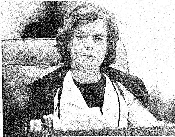
Ministra Carmen Lúcia

Na recente entrevista ao "Roda Viva", de TV Cultura, ela não precisou jorrar conhecimentos jurídicos - que os tem de sobra - nem empunhar as chamadas bandeiras 'libertárias'. Passou sem dificuldades, e com grande capacidade de