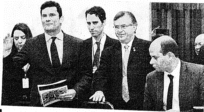
■ Moro cobrou do Congresso medidas efetivas de combate à corrupção

Ele cobrou do Congresso aprovação de leis em relação a esse crime