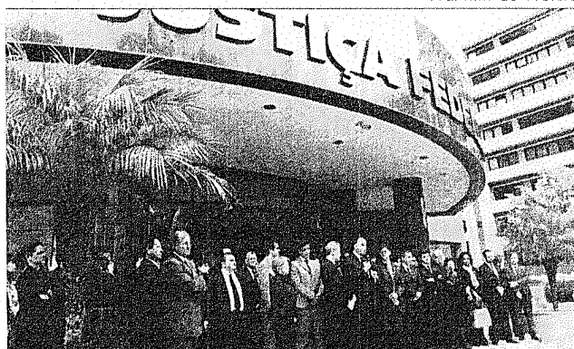
Juízes em ato, ontem, em Curitiba: contra impunidade

Contrária às medidas que alteram o pacote anticorrupção, a Associação Paranaense dos Juízes Federais (APAJU-FE) promoveram o ato com o