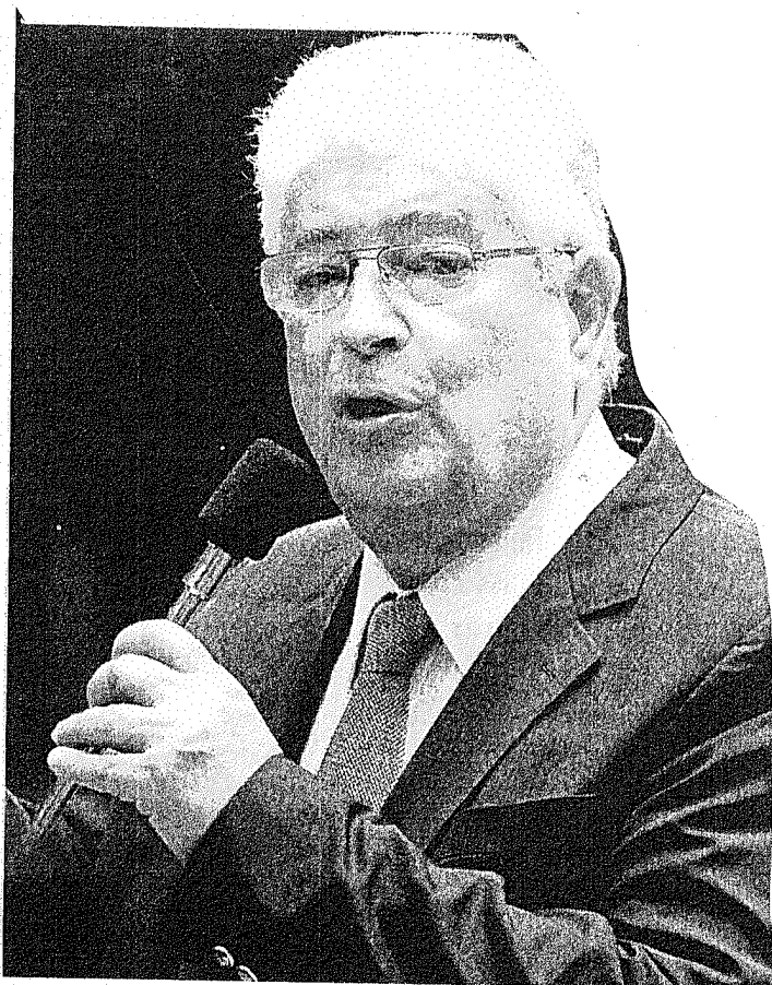
Requião acatou sugestões de juízes, mas manteve conteúdo do PL.

Moro discorda. Ele disse que o texto apresenta avanços ao que estava sendo debatido no Senado, mas que o resultado não corresponde às sugestões. “O mais próximo disso é a norma proposta para o parágrafo único do artigo 1.º, mas a redação é confusa e não atende à sugestão apresentada. Aparentemente, o magis-