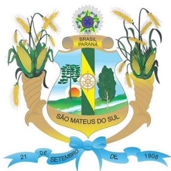
BRASÃO DE SÃO MATEUS DO SUL