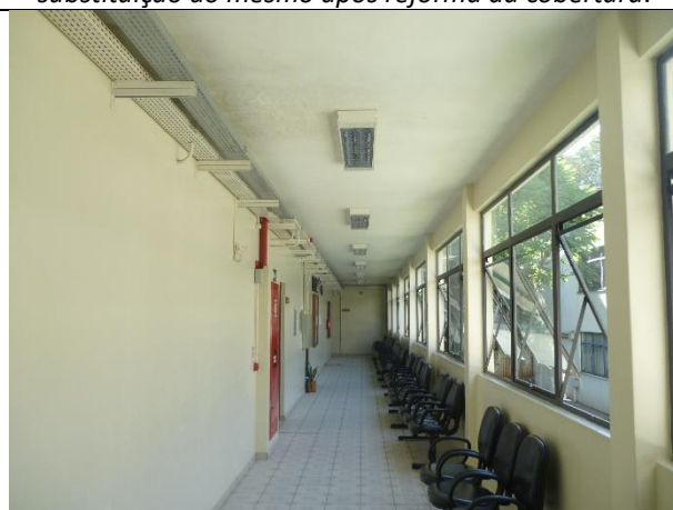
Figura 18 – Detalhe de mancha de infiltração na circulação da edificação.