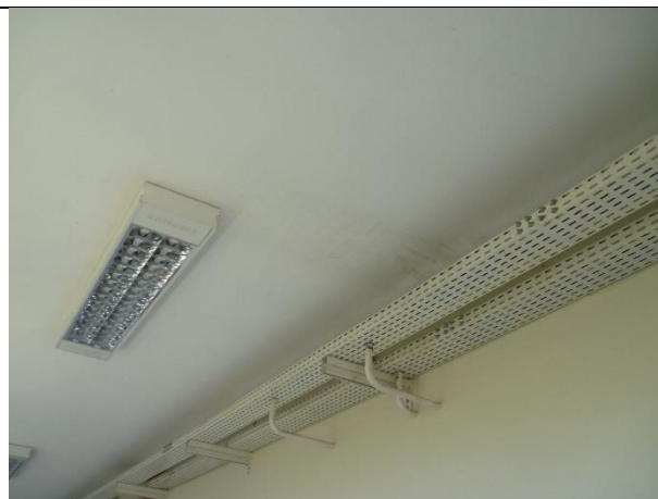
Figura 20 – Detalhe de mancha de infiltração na circulação da edificação.