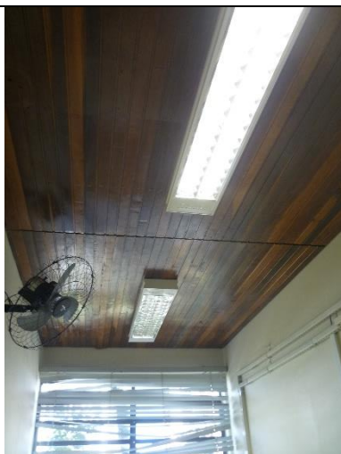
Figura 7 – Detalhe de forro de madeira, necessária substituição do mesmo após reforma da cobertura.