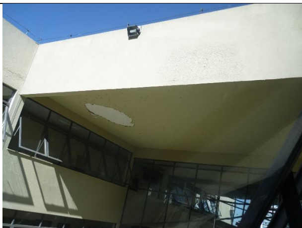
Figura 19 – Detalhe de infiltração.