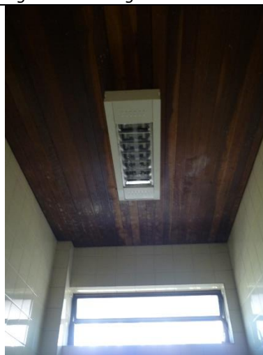
Figura 6 – Detalhe de forro de madeira, necessária substituição do mesmo após reforma da cobertura.