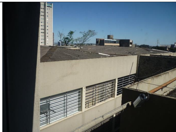
Figura 4 – Vista geral da cobertura.