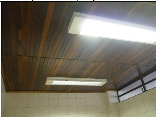
Figura 15 – Detalhe de forro de madeira, necessária substituição do mesmo após reforma da cobertura.