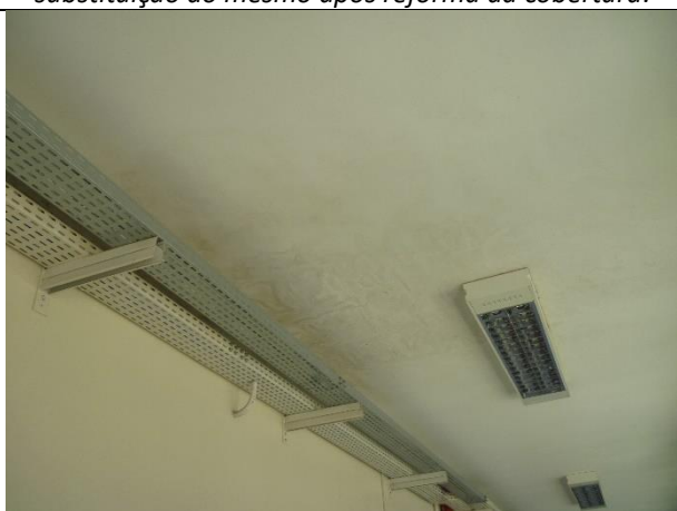
Figura 17 – Detalhe de mancha de infiltração na circulação da edificação.