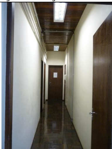
Figura 5 – Detalhe de forro de madeira, necessária substituição do mesmo após reforma da cobertura.