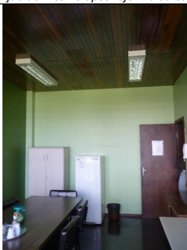
Figura 9 – Detalhe de forro de madeira, necessária substituição do mesmo após reforma da cobertura..