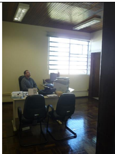
Figura 8 – Detalhe de forro de madeira, necessária substituição do mesmo após reforma da cobertura.