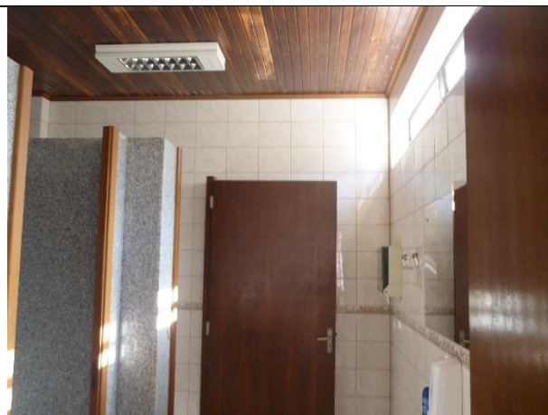
Figura 14 – Detalhe de forro de madeira, necessária substituição do mesmo após reforma da cobertura.