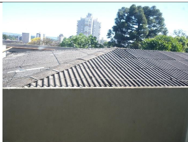
Figura 2 – Vista geral da cobertura.