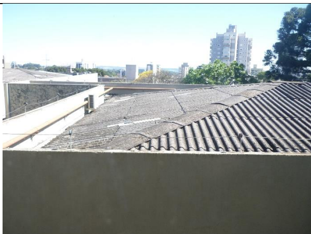
Figura 3 – Vista geral da cobertura.