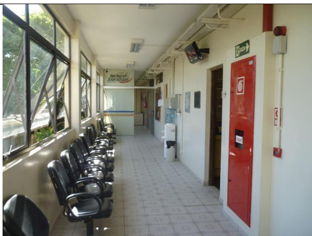
Figura 21 – Detalhe de mancha de infiltração na circulação da edificação.