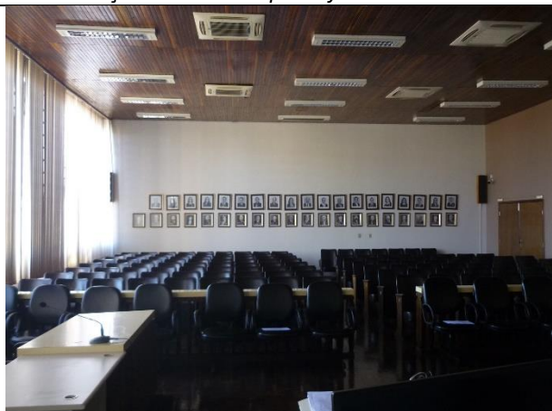
Figura 11 – Detalhe de forro de madeira, necessária substituição do mesmo após reforma da cobertura.