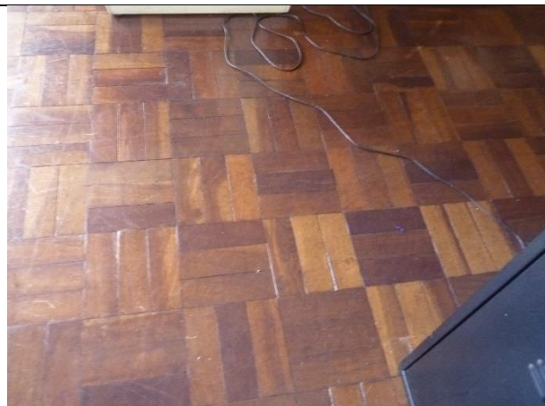
Figura 12 – Detalhe de piso de madeira, necessário reparos.