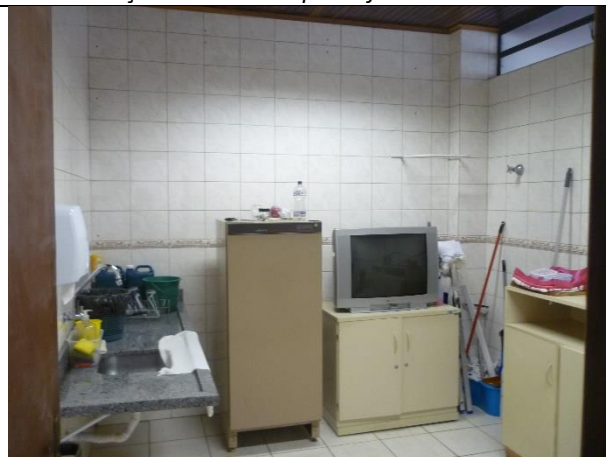
Figura 16 – Detalhe de forro de madeira, necessária substituição do mesmo após reforma da cobertura.