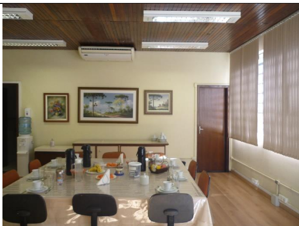
Figura 13 – Detalhe de forro de madeira, necessária substituição do mesmo após reforma da cobertura.