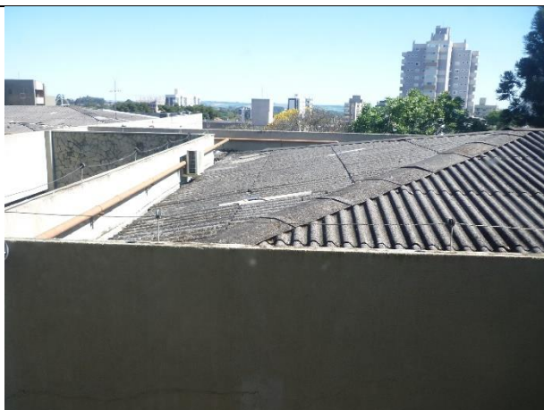
Figura 1 – Vista geral da cobertura.